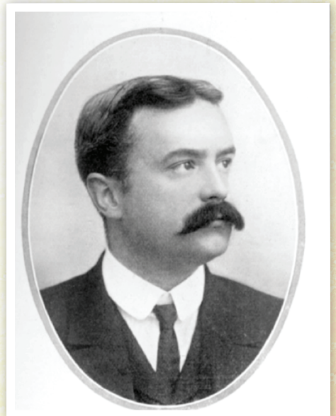
Edmund Morel hevði ein týðandi leiklut í uppperðini við stýrið hjá Leopold 2. Hóast studulin frá Dollanum, verður hann púra burturtagdur í seinni søguskivingini hjá Morel.