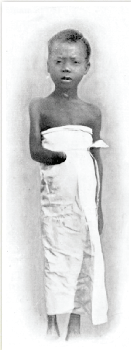
Ein eyðkend mynd hjá Dollanum. Avkvetta armurin á einum hvítum klæði, so hann gerst meira sjónligur.